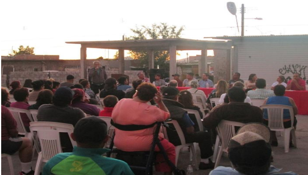
Reunión con vendedores ambulantes