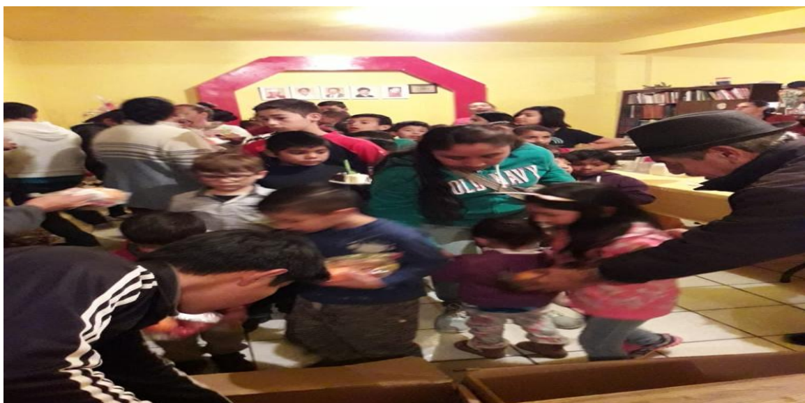
Festejando a los niños