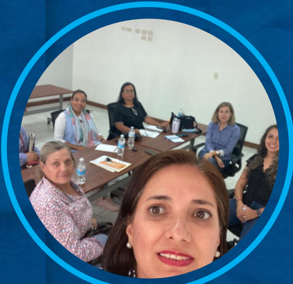
REUNIONES PREVIAS DE CABILDO, COMISIÓN Y DEPENDENCIAS