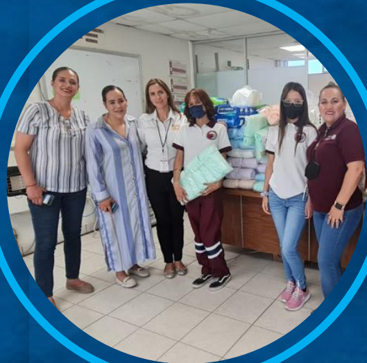
PAÑATON 2022 6399 PAQUETES