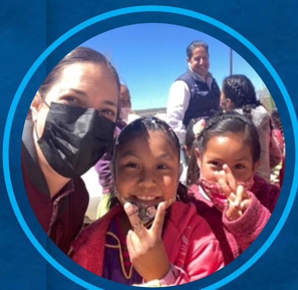
VISITA A COLONIAS Y FAMILIAS VULNERABLES