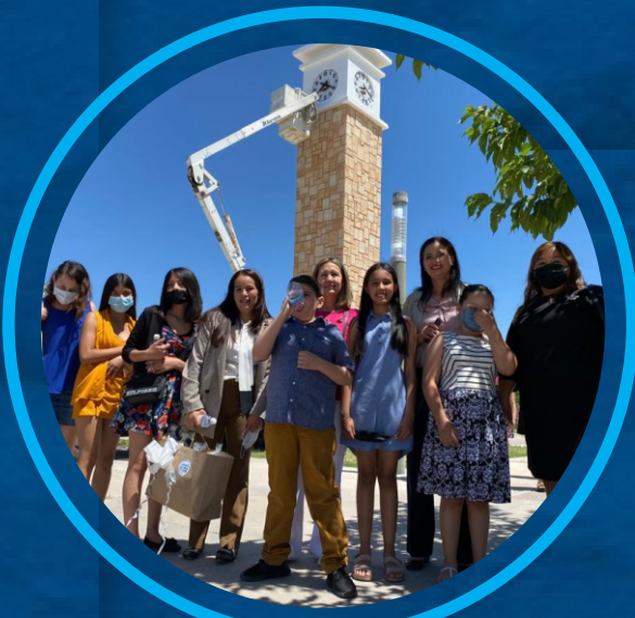
NIÑO PRESIDENTE Y FUNCIONARIO