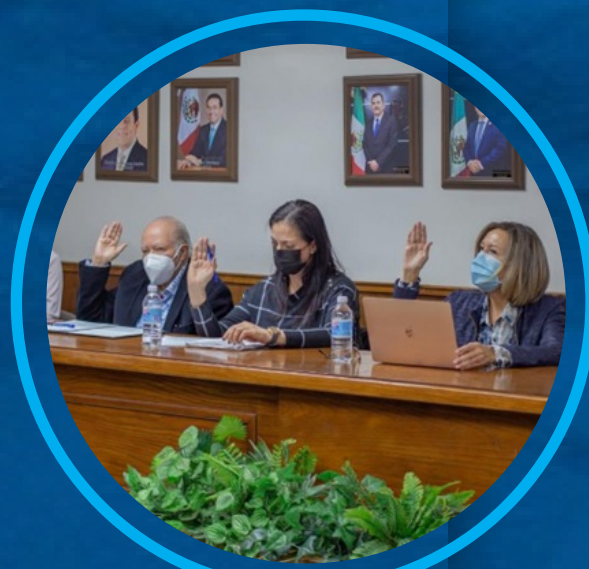
SESIONES DE CABILDO