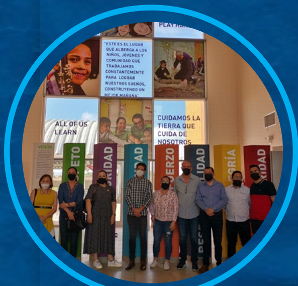
VISITA A DIVERSOS MUNICIPIOS PARA LA IMPLEMENTACIÓN DE PROYECTOS