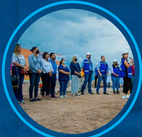
CENTRO COMUNITARIO CUMBRES DEL DEPORTE