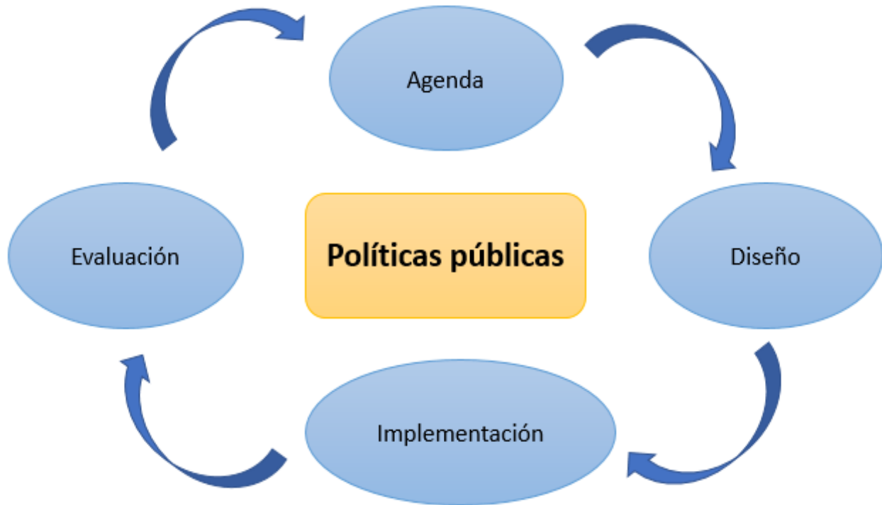
Imagen No. 1 Ciclo de las Políticas Públicas